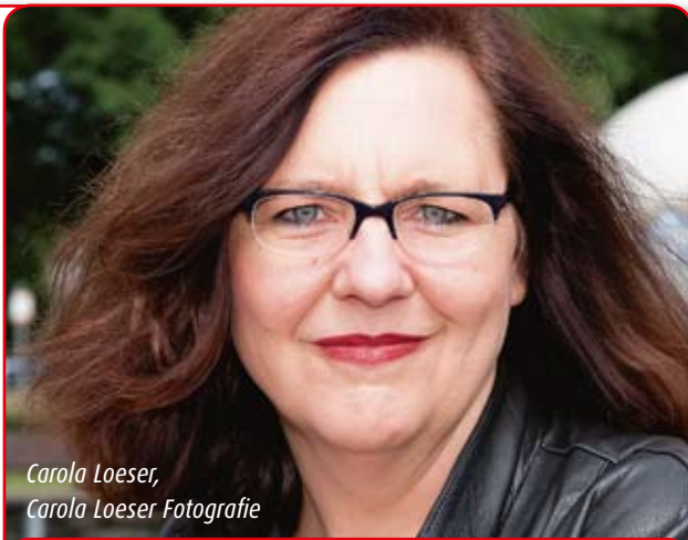
Carola Loeser, Carola Loeser Fotografie

“ Nach intensiver Recherche und der Beratung durch Fachleute stand meiner Selbstständigkeit nichts mehr im Wege. ”