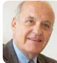
PROF. GÖTZ W. WERNER

Prof. Götz W. Werner wird in seinem Vortrag den Zusammenhang dieser drei Säulen darstellen: Die Zielsetzungen, seinen eigenen Weg selbstbestimmt als Existenzgründerin und JungunternehmerIn zu finden, etwas für andere zu tun und daraus einen Kundennutzen zu generieren sowie mit Hilfe unternehmerischen Denkens ein zukunftsträchtiges Unternehmen zu gestalten.